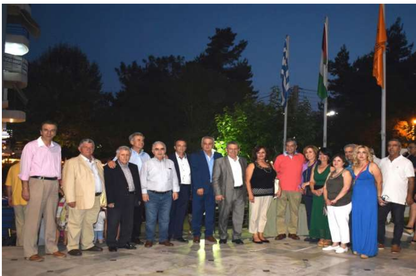
Ο Δήμαρχος Ιλίου Νίκος Ζενέτος με τον Πρέσβη της Παλαιστινιακής Αρχής στην Ελλάδα Marwan Emile Toubassi και τη συζύγο του Mirna Toubassi, οι οποίοι παρευρέθηκαν στην «Λευκή Νύχτα», Αντιδημάρχους και Δημοτικούς Συμβούλους του Δήμου Ιλίου.